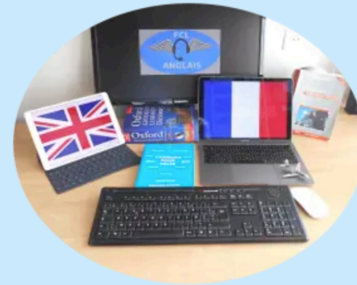
TRANSLATION – TRADUCTION