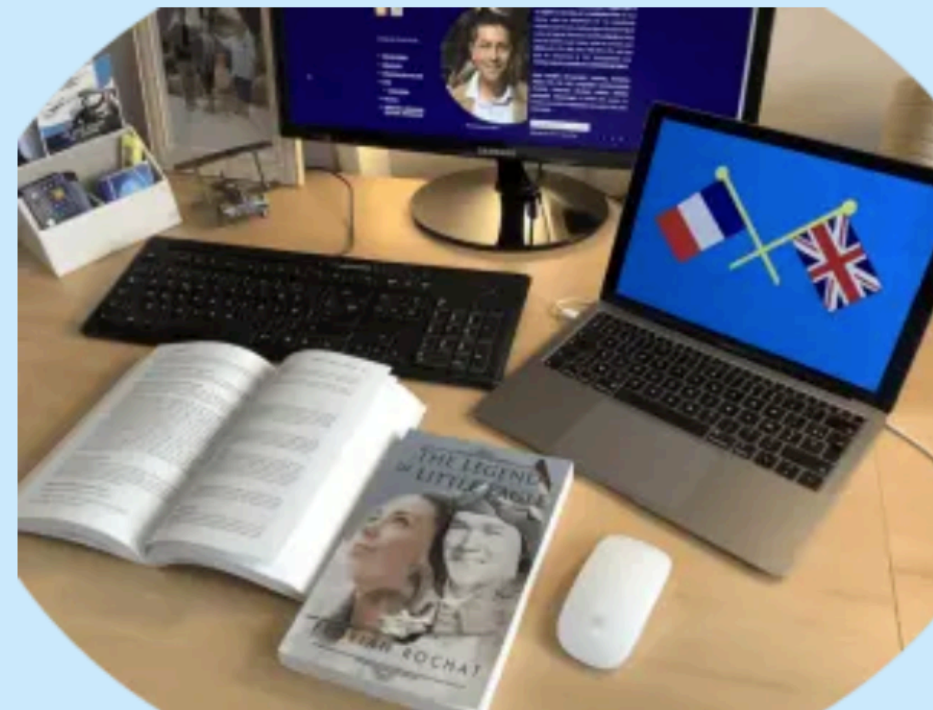
PROOFREADING – RELECTURE

Avant de commander, demandez toujours un devis. Les tarifs sont fixés à 0,11 traduction et 0,11 euros le mot pour la relecture. Néanmoins, suivant le volume peuvent être revus à la baisse ou à la hausse. Plus d'informations par message page Contact ou au +33 6 67 15 75 62. Vous pouvez cliquer pour plus de détails: